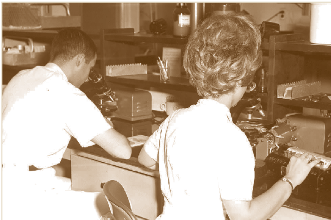
Un grand nombre de photos d'archives et d'artefacts de l'histoire de l'HGJ (comme cette photo de techniciens au travail dans un laboratoire, vers 1963) sont accessibles sur le nouveau site Web des Archives.